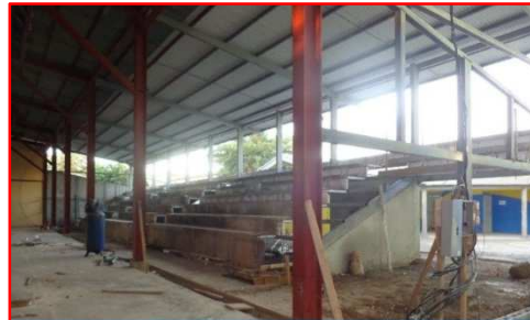
Balonmano Panorámica de la construcción de las graderías en el costado oeste del Gimnasio de.

En Febrero 2017 se obtuvo un avance del 38.86% en la ejecución de las actividades de instalación de estructura metálica de gradería, cerramiento de paredes y construcción de gradería con covintec, instalación de estructura metálica y cubierta en áreas de jueces y bancas.