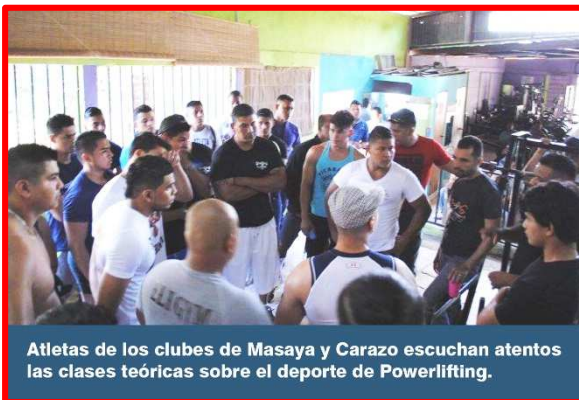
Atletas de los clubes de Masaya y Carazo escuchan atentos las clases teóricas sobre el deporte de Powerlifting.

El sábado 11 de febrero, se celebró el “I Seminario de Reglas Generales de Potencia de