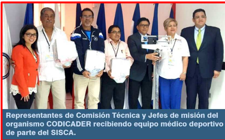
Representantes de Comisión Técnica y Jefes de misión del organismo CODICADER recibiendo equipo médico deportivo de parte del SISCA.

En el marco de la “I Reunión Ordinaria 2017 del Comité Directivo del Consejo del Istmo Centroamericano de Deporte y Recreación” (CODICADER), la SISCA hizo entrega de equipo médico deportivo, así como indumentaria deportiva para los miembros de la Comisión Técnica y Jefes de Misión del Consejo.