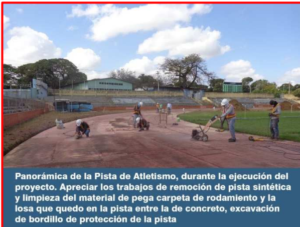
Panorámica de la Pista de Atletismo, durante la ejecución del proyecto. Apreciar los trabajos de remoción de pista sintética y limpieza del material de pega carpeta de rodamiento y la losa que quedo en la pista entre la de concreto, excavación de bordillo de protección de la pista

El proyecto está siendo ejecutado por el contratista Consorcio Canchas Deportivas, por un monto de C$ 14, 128,076.00. La obra se inició el 07 de febrero 2017, con un plazo de ejecución de 160 días calendario, teniendo previsto la finalización el 16 de julio del 2017.