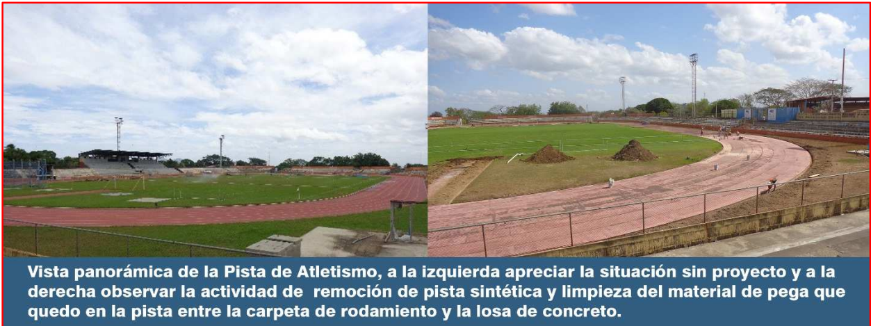
Vista panorámica de la Pista de Atletismo, a la izquierda apreciar la situación sin proyecto y a la derecha observar la actividad de remoción de pista sintética y limpieza del material de pega que quedo en la pista entre la carpeta de rodamiento y la losa de concreto.

Obra: Reemplazo de Piso en Pista de Atletismo del IND: Este proyecto consiste en el reemplazo de la superficie actual de la pista de atletismo, mediante la instalación de superficie certificada y aprobada por las reglamentaciones internacionales de atletismo.