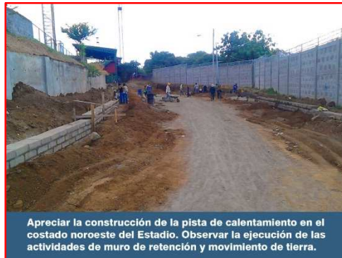
Apreciar la construcción de la pista de calentamiento en el costado noroeste del Estadio. Observar la ejecución de las actividades de muro de retención y movimiento de tierra.