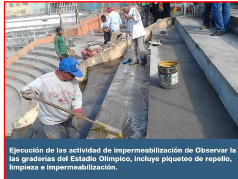
Ejecución de las actividad de impermeabilización de Observar la las graderías del Estadio Olímpico, incluye piqueteo de repello, limpieza e impermeabilización.

El proyecto consiste en la construcción de pista de atletismo para calentamiento con superficie asfáltica, con una dimensión longitudinal de 132.00 m con 4 carriles, sala de certificación, fotofinish y sala técnica. A la vez se rehabilitará los servicios sanitarios para el público y camerinos en áreas techadas y no techadas del estadio; mejoramiento de accesos principales, mejoramiento de graderías y obras exteriores para brindar un mejor confort a los atletas y público en general. Está siendo ejecutado por la empresa Sociedad Wilson Construcciones Sociedad Anónima (WILCONSA); por un monto inicial de C$ 20, 001,875.27. La obra se inició el 31 de enero 2017, con un plazo de ejecución de 145 días calendario, teniendo previsto la finalización el 24 de junio del 2017.