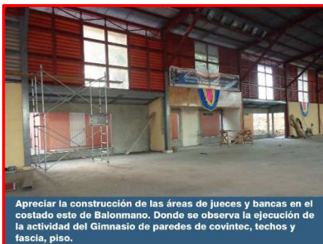
Apreciar la construcción de las áreas de jueces y bancas en el costado este de Balonmano. Donde se observa la ejecución de la actividad del Gimnasio de paredes de covintec, techos y fascia, piso.

El proyecto consiste en la finalización de las graderías del sector oeste que actualmente se encuentra a nivel de fundaciones, estructura de techo y cubierta de techo, En este componente se contempla finiquitar todos los elementos metálicos en la gradería en cuanto a vigas y columnas, forros de las graderías con panel de malla electrosoldada, barandales, piso de concreto, ventanas de celosías, puertas metálicas y obras de electricidad, además de delimitar el área de juego ( cancha ) con un barandal de tubo y malla ciclón y pintura. Debajo de las graderías se ha destinado 3 ambientes para bodegas; además en este sector se jerarquiza el acceso a público espectador. El área de gradería es de 205 m 2 y con una capacidad de 300 personas. Está siendo ejecutado por el contratista Ricardo José Murillo Rodríguez; por un monto inicial de C$ 3, 681,939.57. La obra se inició el 10 de enero 2017, con